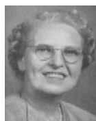
Musgrave, Ruth Lokole (1918-57)

donné l'occasion d'être en contact étroit avec les gens.